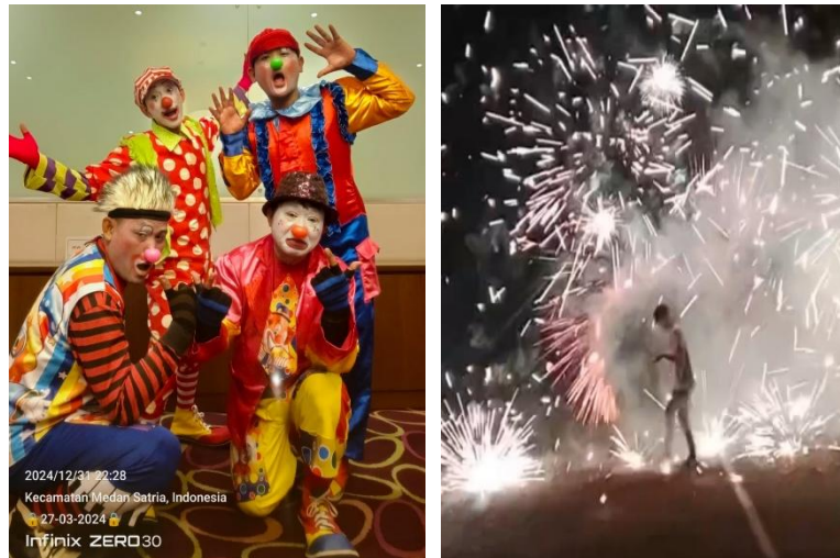
Gambar 2. Penampilan Ultah dan Kembang Api Rumah Badut