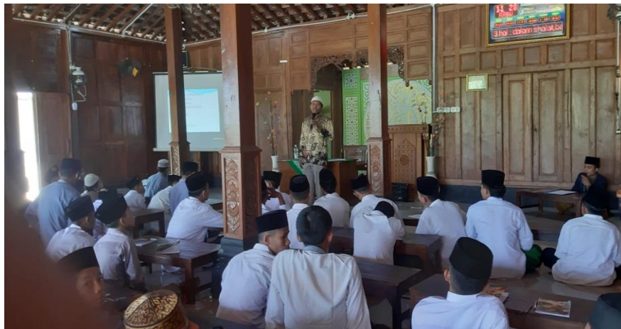
Gambar 0.3 Penyampaian Materi Seminar Pada Acara MLPS Santri Baru Ponpes Mardhatullah Al Islamy