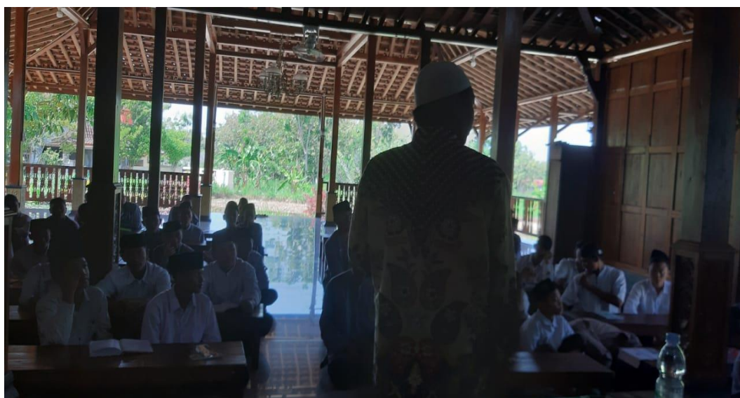
Gambar 0.4 Sharing