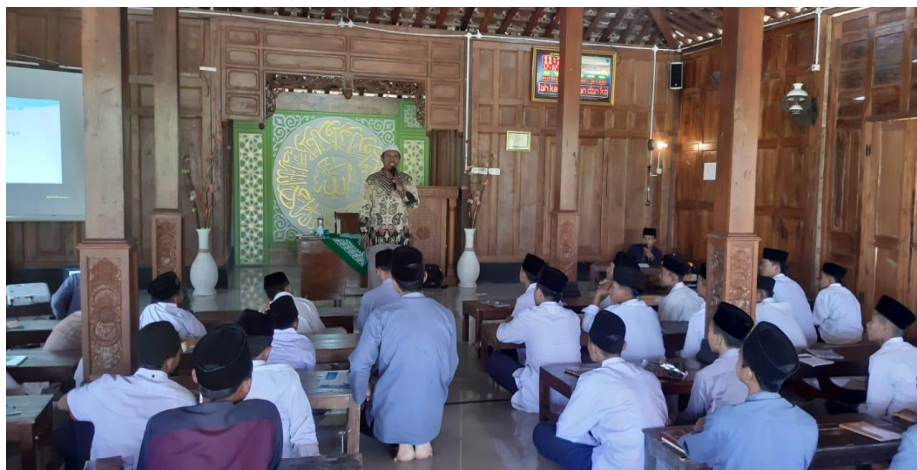
Gambar 0.2 Peserta MPLS Ponpes Mardhatullah Al Islamy