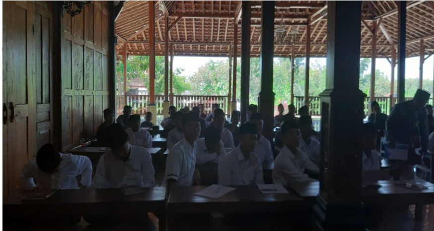
Gambar 0.1 Pengondisian Kelas sebelum materi dimulai