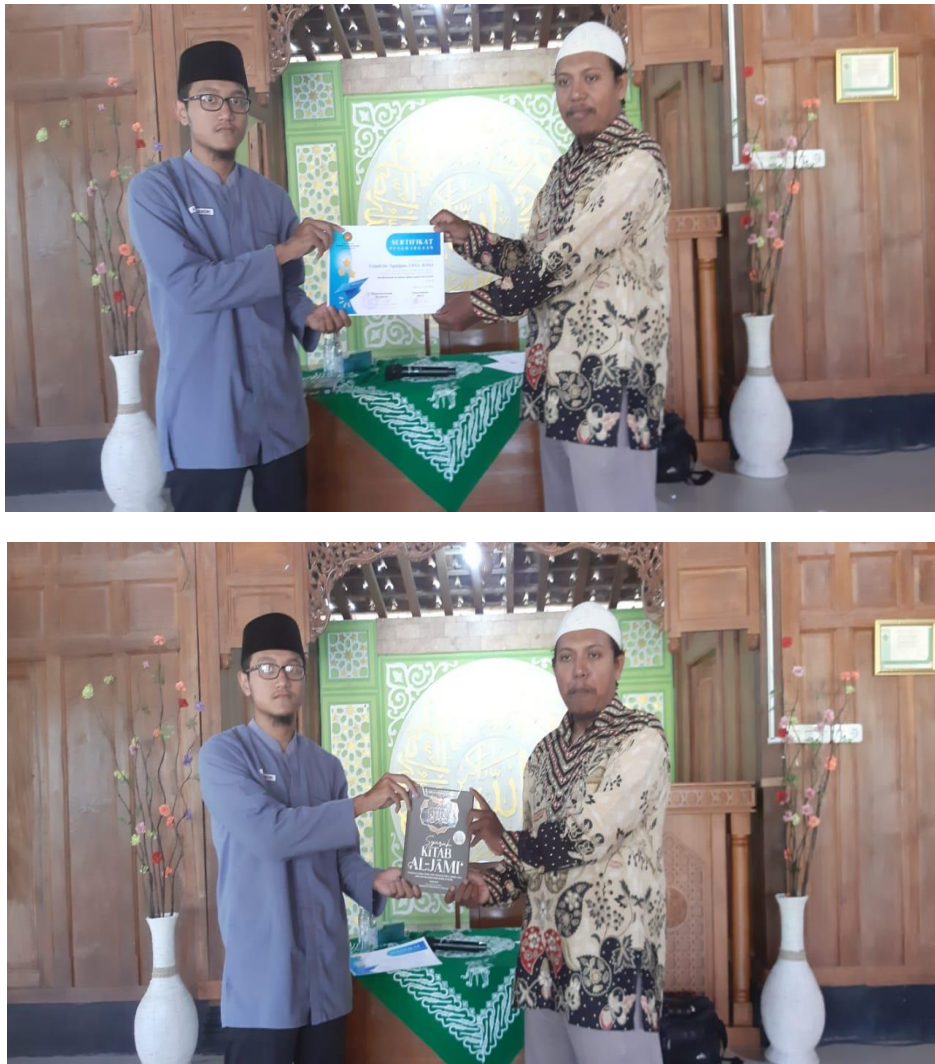
Gambar 5. Penyerahan Sertifikat Ucapan Terima Kasih & Kenang-kenangan