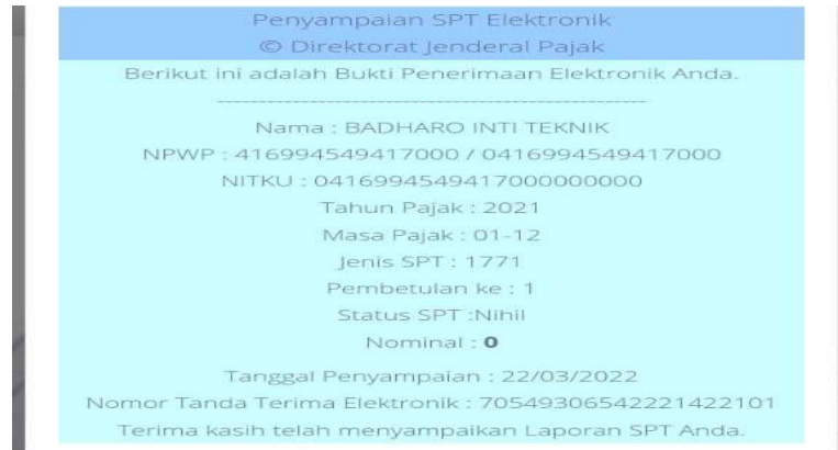
Gambar 3 : BPE SPT Tahunan PT. Badharo Inti Teknik tahun 2021