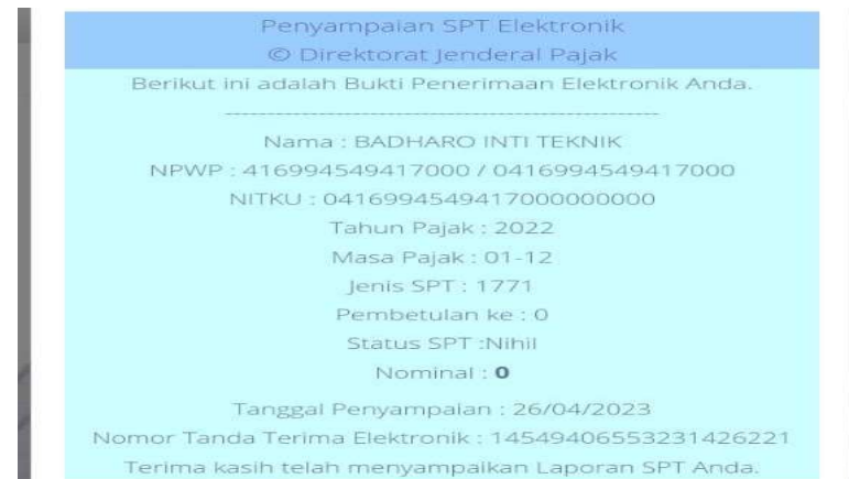
Gambar 4 : BPE SPT Tahunan PT. Badharo Inti Teknik tahun 2022