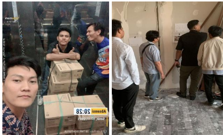
Gambar 2. Pendampingan Tenaga Kerja Lapangan PTEwako Internusa Kreatif

berbagai studi terdahulu yang menempatkan manajemen SDM sebagai faktor kunci dalam keberhasilan proyek konstruksi