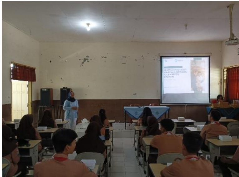
Gambar 6. Pemaparan Materi