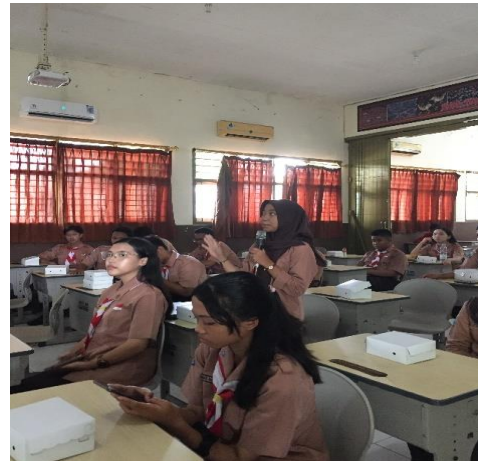
Gambar 3. Antusiasme Peserta Saat Sesi Sharing