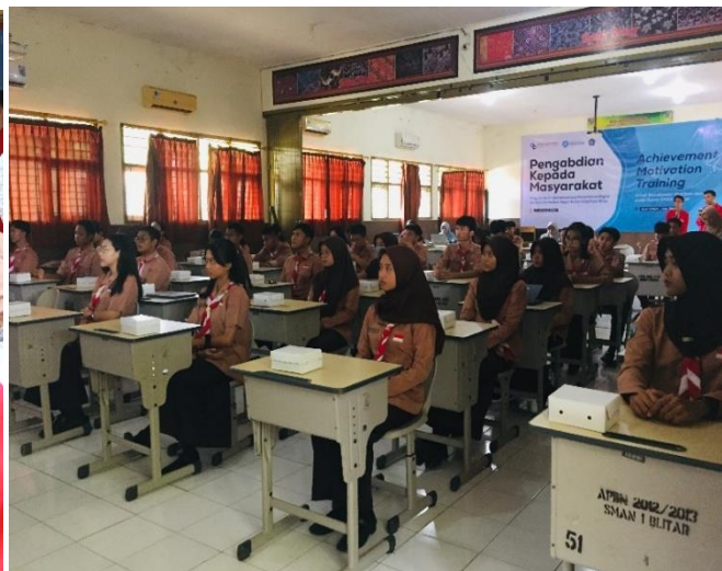
Gambar 5. Persiapan Acara Hadir