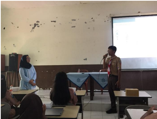
Gambar 2. Antusiasme Peserta Saat Sesi Tanya Jawab

Kegiatan ini diikuti oleh 50 siswa yang merupakan pengurus OSIS SMA Negeri 1 Blitar dan pengurus unit kegiatan siswa. Seluruh peserta menunjukkan antusiasme yang tinggi selama pelatihan. Hal ini ditunjukkan melalui keaktifan peserta dalam sesi diskusi dan sharing .