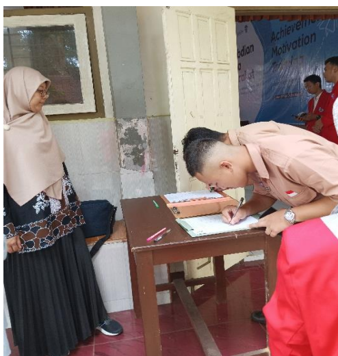
Gambar 4. Pengisian Daftar Hadir

Kegiatan pengabdian dimulai dengan registrasi dan persiapan. Peserta pelatihan dikumpulkan dalam ruang selama sesi-sesi berlangsung. Acara dibuka dengan sambutan dari Kepala SMA 1 Blitar dan panitia penyelenggara yang menyampaikan tujuan dan harapan dari kegiatan tersebut.