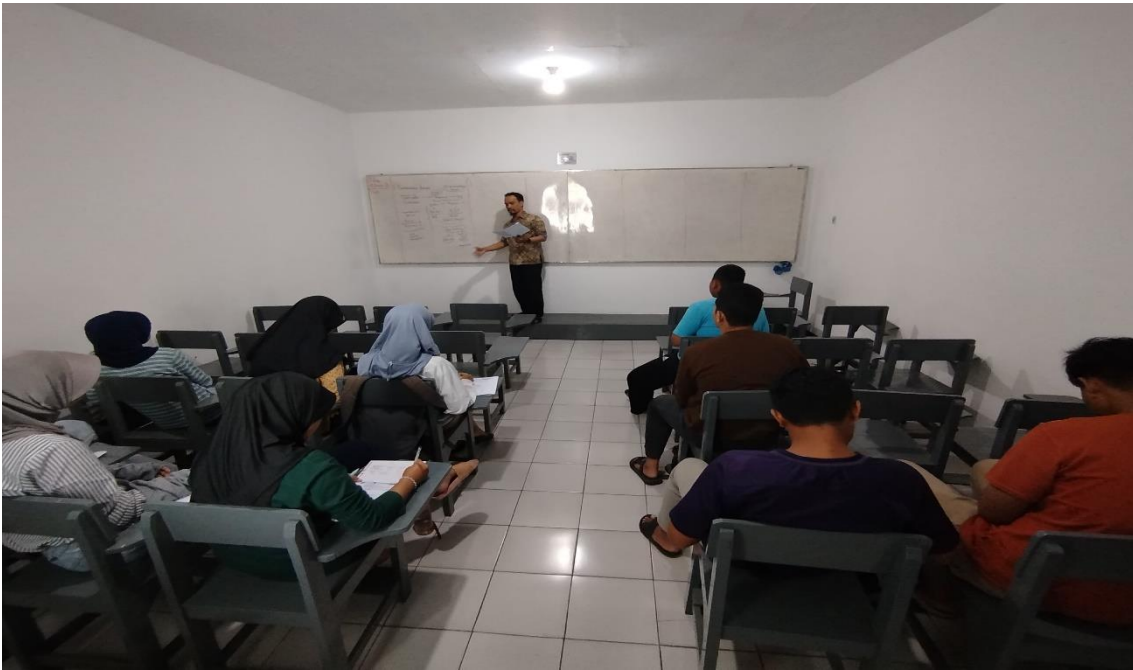
Gambar 3. Pembahasan Soal-Soal Latihan TWK

Program ini juga membuka peluang untuk menciptakan jaringan komunikasi yang lebih luas antara peserta dan pihak-pihak terkait, seperti lembaga bimbingan belajar dan sekolah kedinasan. Melalui diskusi dan pelatihan, peserta dapat bertukar informasi, berbagi pengalaman, dan membangun hubungan yang saling mendukung. Interaksi ini menjadi nilai tambah yang dapat memperkuat komitmen peserta dalam mencapai tujuan mereka. Dengan adanya dukungan dari tim pengabdian, mitra, dan sesama peserta, program ini tidak hanya berfungsi sebagai pelatihan teknis, tetapi juga menjadi katalisator dalam membangun komunitas yang saling menginspirasi untuk meraih keberhasilan bersama.