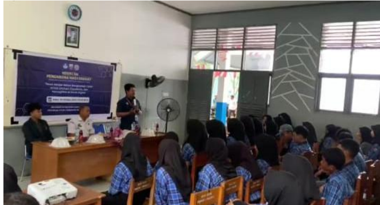
Gambar 3. Pembukaan Kegiatan