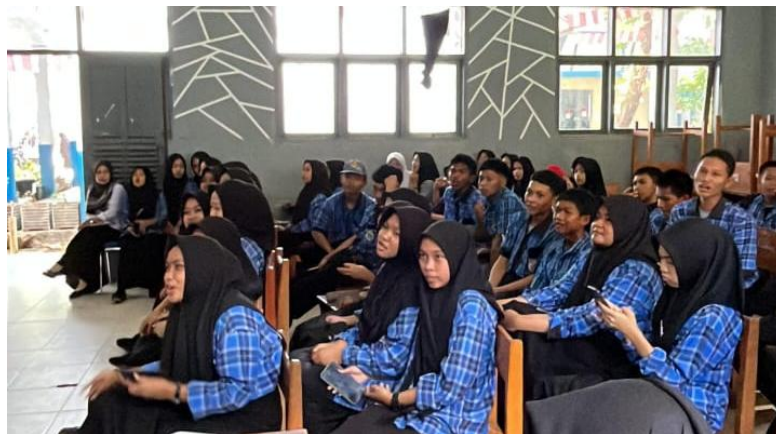
Gambar 4. Presentasi kegiatan