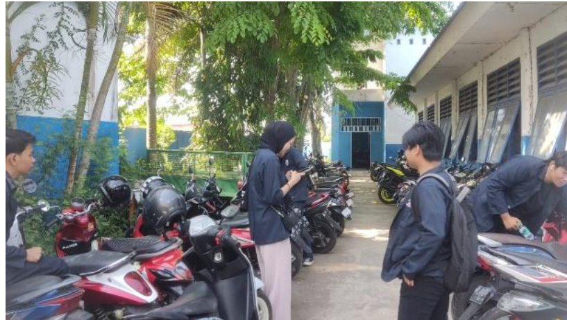
Gambar 2. Observasi ke SMKN 1 Maros