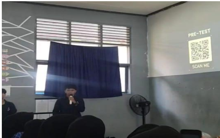
Gambar 5. Pelaksanaan Pretest