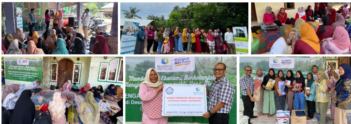
Gambar 2. Kegiatan Perencanaan, Pelatihan, & Pendirian Rumah Produksi Sejahtera Desa Ligarmukti

Maka hasil ini menunjukkan tidak hanya keberhasilan program dari sisi teknis dan manajerial, tetapi juga menegaskan pentingnya wadah seperti Rumah Produksi Sejahtera sebagai ruang kolaborasi, edukasi, dan pemberdayaan perempuan di tingkat komunitas desa (Ali et al., 2023; Safitri & Latifah, 2024).