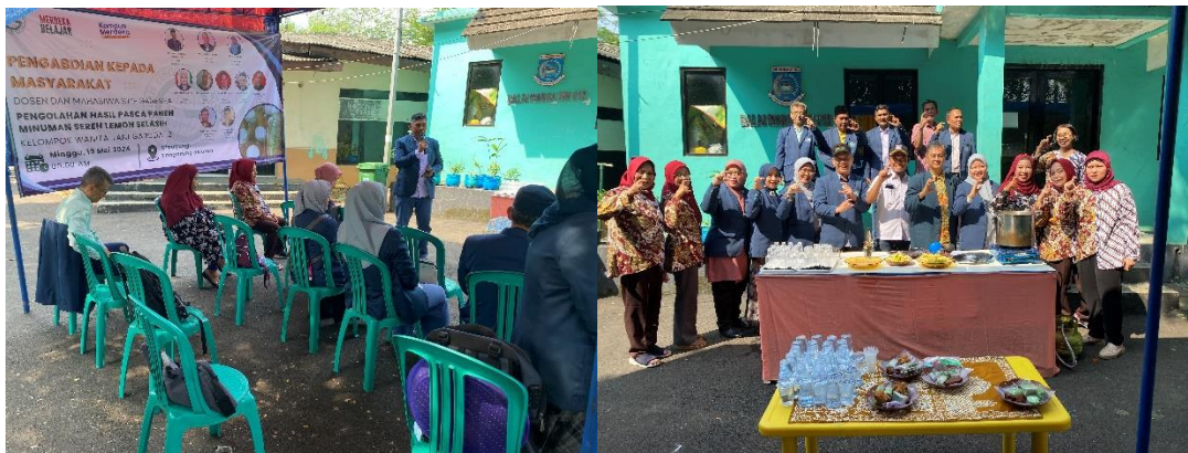
Gambar 3. Presentase materi oleh Dosen dan Pose Bersama Anggota KWT Garuda Di Lokasi

Menurut (Margayaningsih, 2020), Kelompok Wanita Tani berfungsi sebagai wadah bagi masyarakat, terutama kaum wanita, untuk mengelola dan mengekspresikan berbagai pemikiran di bidang pertanian, serta sebagai sarana untuk memperoleh pengetahuan dan wawasan bagi anggotanya. Dengan demikian, diharapkan kegiatan kelompok ini dapat menjadi kreatif dan mengikuti perkembangan zaman. Kelompok Wanita Tani melaksanakan berbagai peran yang memberikan manfaat positif, antara lain sebagai ruang belajar melalui kegiatan rutin dan pelatihan yang diselenggarakan, sebagai wadah kerjasama dalam usaha kesejahteraan masyarakat, serta meningkatkan kreativitas dalam pengelolaan pertanian untuk meningkatkan pendapatan.