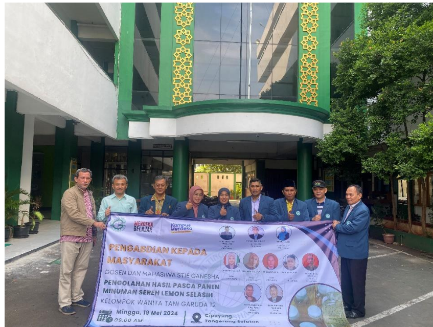
Gambar 2. Pelepasan Peserta PKM Sebelum ke Lokasi

Salah satu kendala yang dihadapi adalah keterbatasan sumber daya, seperti peralatan produksi dan modal usaha, yang masih menjadi hambatan dalam meningkatkan skala produksi. Selain itu, beberapa anggota mengalami kesulitan dalam mengadopsi teknologi pemasaran digital yang diperkenalkan selama pelatihan, sehingga memerlukan pendampingan berkelanjutan. Fluktuasi permintaan pasar juga menjadi tantangan, mengingat produk baru ini masih dalam tahap penetrasi pasar.