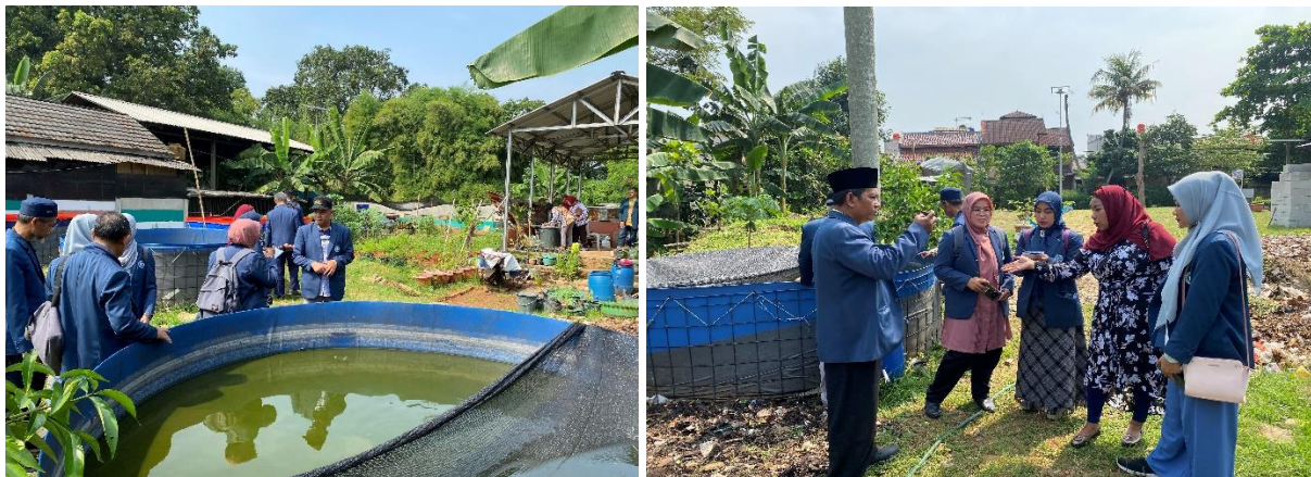
Gambar 4. Dosen meninjau lokasi kebun Kelompok Wanita Tani Garuda

Ketercapaian program dengan indikasi kuantitatif yaitu jumlah anggota yang mengikuti pelatihan pengemasan (25 anggota), jumlah produk yang berhasil dikemas dengan metode ramah lingkungan (misalnya, 100 botol menggunakan kemasan biodegradable). Sedangkan secara kualitatif yakni adanya penilaian kualitas kemasan dari perspektif konsumen, diukur melalui survei kepuasan konsumen, serta observasi langsung tentang penerapan teknik pengemasan yang diajarkan selama pelatihan.